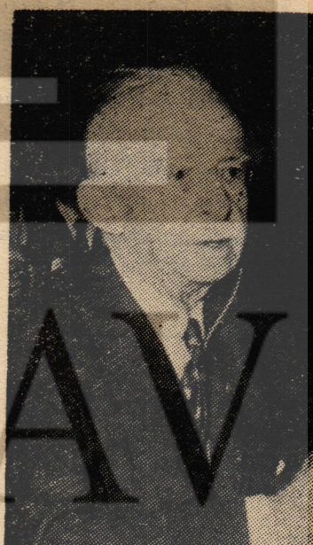
BAŞBAKAN İNÖNÜ Varsa Amerika, yoksa Amerika