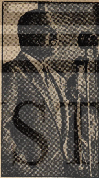
BAŞKAN NÂSIR «Yurtta sulh, cihanda sulh»