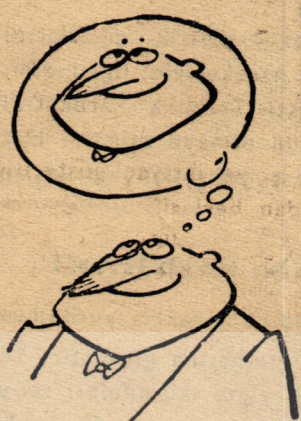
ÖZÜRÜDEN ÇOK SEVMektir.